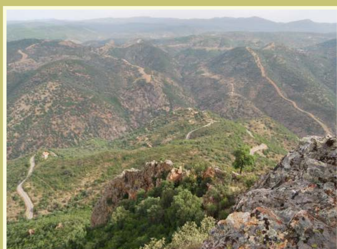
Panorámica de la Umbría de la Huesa desde la cima del Castro y Picón