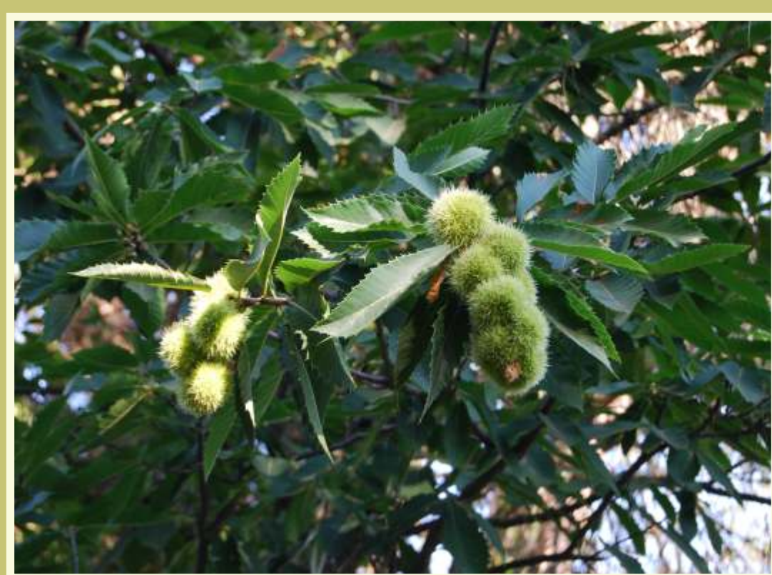
Detalle del fruto inmaduro de un castaño