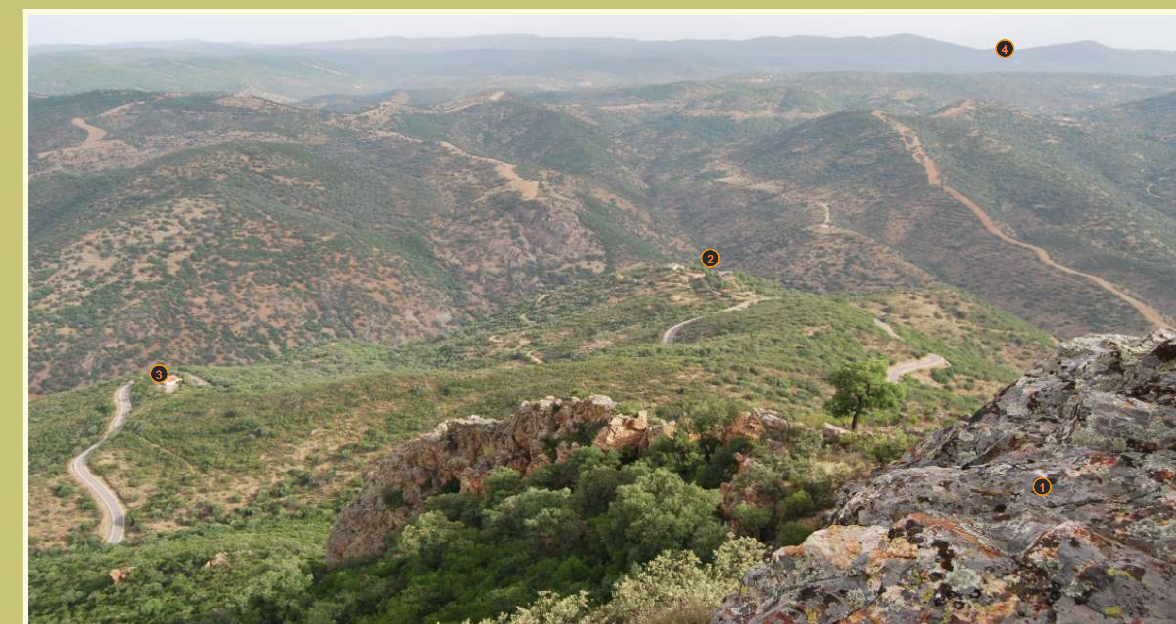
Vista de la cuenca del Río Guadiato desde la cumbre granítica de Castro y Picón (1). Puede divisarse el barranco de La Huesa (2), la casa de La Plata (3) y al fondo, las fuentes del Guadiatillo entre los cerros de Peñaspardas y Cruce (4).