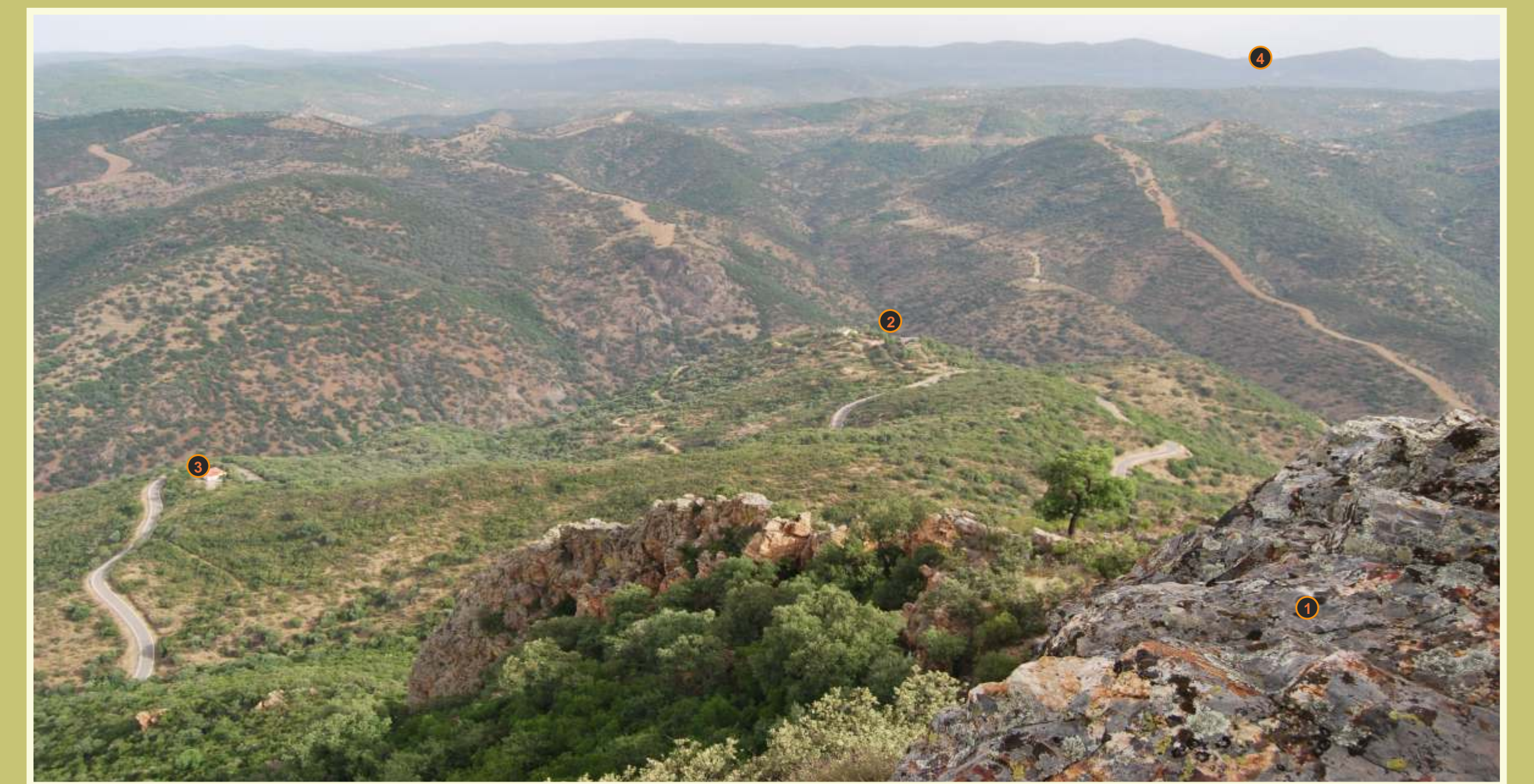
Vista de la cuenca del Río Guadiato desde la cumbre granítica de Castro y Picón (1). Puede divisarse el barranco de La Huesa (2), la casa de La Plata (3) y al fondo, las fuentes del Guadiatillo entre los cerros de Peñaspardas y Cruce (4).

La información histórica y los testimonios orales recogidos en este itinerario han sido aportado por el Foro por la Memoria y extraídos del libro “Claves Sociales y Naturales de la Guerrilla Antifranquista en Sierra Morena.” Luis Naranjo, Manuel Moral, Miguel Carrasco, 2006, editado por la Diputación Provincial de Córdoba y el Ayto. de Villaviciosa.