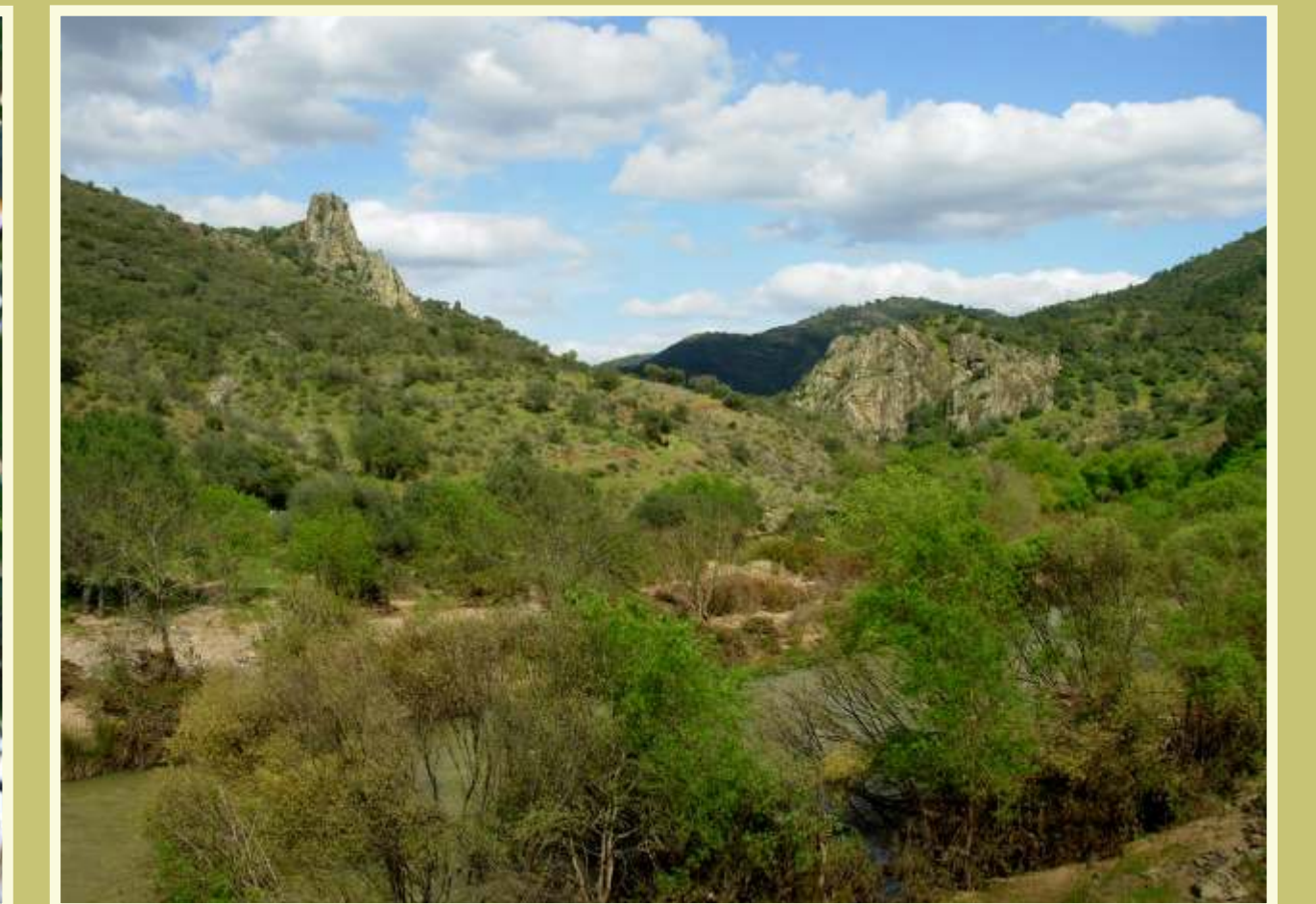
El cauce del Guadiato constituye una vía natural de comunicación que conecta a través de la Peña Talavera con la carretera Córdoba-Villaviciosa de Córdoba.