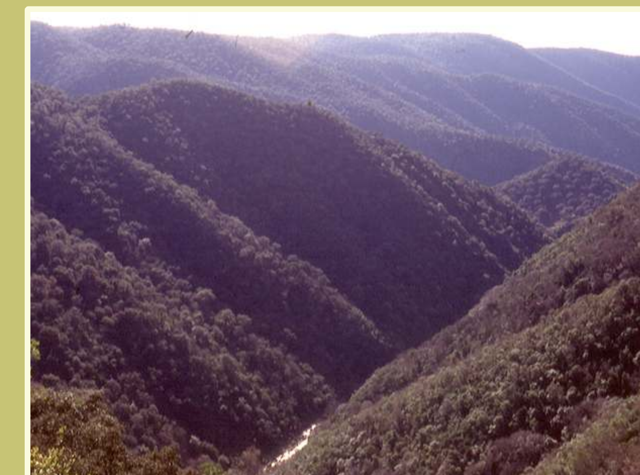
La espesura de las laderas del Guadiatillo permitieron el movimiento protegido y seguro de las partidas guerrilleras por esta parte de Sierra Morena.