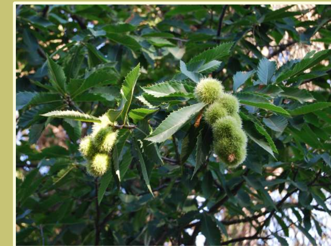
Detalle del fruto y hoja del castaño ( Castanea sativa ).

En la margen derecha, frente a La Porrá, el Cerro del Trigo (que era llamado La Madre de los Lobos ) constituyó otra zona de fuerte presencia guerrillera, vinculada a los huidos de Villaviciosa. La mayoría de estos maquis, de filiación política anarquista, acabaron integrados en la AGE (Agrupación Guerrillera Española), junto con otros muchos republicanos, de filiación socialista o comunista.